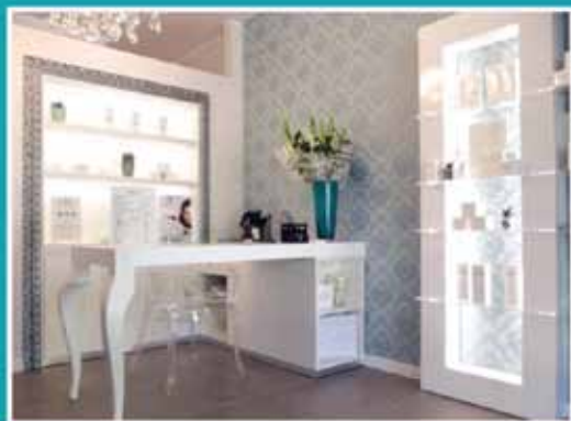
Centro Estetico Eden

В Сояно стоит также посетить церкви San Michele Arcangelo и San Carlo.