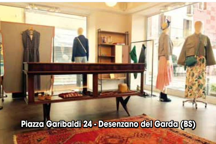
Piazza Garibaldi 24 - Desenzano del Garda (BS)

BOX24 - это концептуальный магазин в самом центре Дезенцано. Женская одежда и аксессуары, все сделано только в Италии.